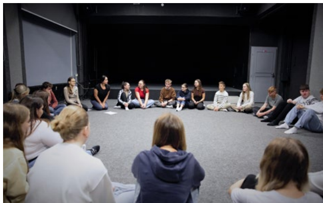
↑ Ilustrační foto Veronika Prachařová