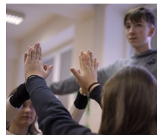
↑ Ilustrační foto Veronika Prachařová