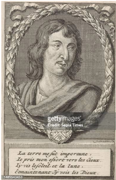
HECTOR-SAVINIEN DE CYRANO (1619–1655)