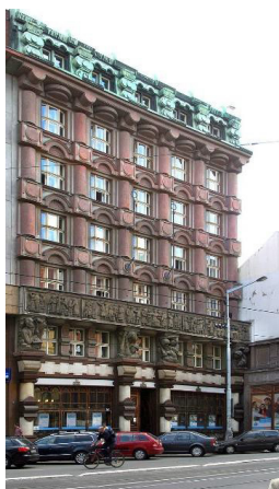
pozdější sídlo divadla D 34 v ulici Na Poříčí – dnešní Divadlo Archa