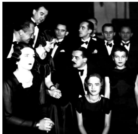
E. F. Burian se svým voicebandem