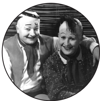
Jan Werich a Jiří Voskovec

Přesuneme se zhruba o sto let zpět. Lidstvo je poznamenáno válečnými hrůzami. Po první světové válce poprvé v historii existuje samostatný československý stát. Období dvacátých a třicátých let 20. století tradičně nazýváme první republika. Společnost se změnila a s ní i smýšlení o životě, ale i o umění. Nastupující umělecké hnutí zvané avantgarda (v původním slova smyslu vojenský předvoj) přišlo s konkrétním programem nového světa a jeho řádu, když kladlo důraz na úzké propojení umění a revoluce. České avantgardní hnutí bylo součástí programu uměleckého svazu Devětsil. Divadelní avantgarda se u nás začala projevovat roku 1925 a tvořila divadelní sekci zmiňovaného Devětsilu. Roku 1926 se na divadelní scéně objevuje Osvobozené divadlo v čele s Jiřím Frejkou, Jindřichem Honzlem a Emilem Františkem Burianem. Začátkem 30. let avantgardu reprezentuje Osvobozené divadlo Voskovce a Wericha a divadlo D 34 E. F. Buriana, který se rozhodl jít svou vlastní cestou. Třetí dekáda minulého století znamenala opětovné hledání odpovědí na otázky po smyslu českého divadla jakožto veřejné kulturní instituce.