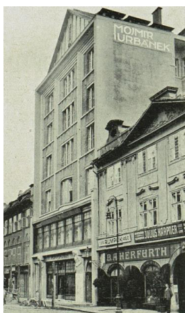
původní sídlo divadla D 34 – pražské Mozarteum