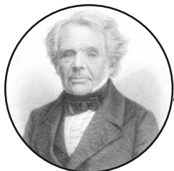
August Ferdinand Möbius (1790–1868)

Anglický fyzik a astronom, objevitel gravitačního zákona.