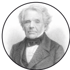
August Ferdinand Möbius (1790–1868)

Anglický fyzik a astronom, objevitel gravitačního zákona.