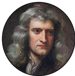
Isaac Newton (1643–1727)