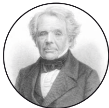
August Ferdinand Möbius (1790–1868)

Anglický fyzik a astronom, objevitel gravitačního zákona.