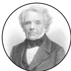
August Ferdinand Möbius (1790–1868)

V zásadním díle celé historie moderní vědy Matematické základy přírodovědy formuloval tzv. Newtonovy zákony.