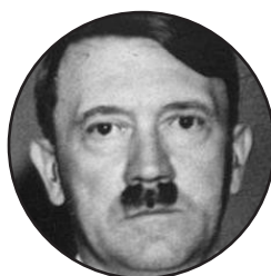
Adolf Hitler (Německo)