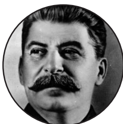
Josif Vissarionovič Stalin