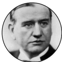
Édouard Daladier (Francie)

➤ V noci z 29. na 30. září 1938 se v bavorském městě Mnichově setkali představitelé čtyř evropských mocností.