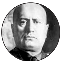
Benito Mussolini (Itálie)