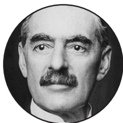
Arthur Neville Chamberlain

Přiřad'te medailonky ke jmenům s fotografiemi.