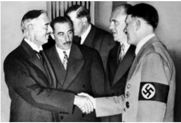
A. N. Chamberlain si podává ruku s A. Hitlerem na mnichovské konferenci.