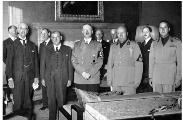
Zleva: A. N. Chamberlain, É. Daladier, A. Hitler a B. Mussolini.